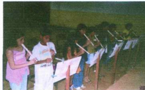
Alunos juniores, de iniciação musical turno matutino (ano 2005)