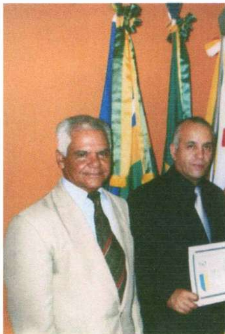
Ambos autores juntos