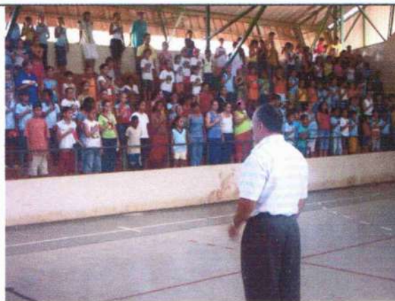
Alunos das escolas de Jesupolis, em peso no evento que abriu as aulas de iniciação musical em ambos os municípios.