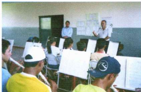
Primeira apresentação em conjunto na sede da antiga prefeitura, em São Fco.de Goias. Coincidentemente no aniversário do Prof. Watsson em 11 de dezembro de 2005. Os alunos tocaram, além de várias musica, o parabéns a voce.