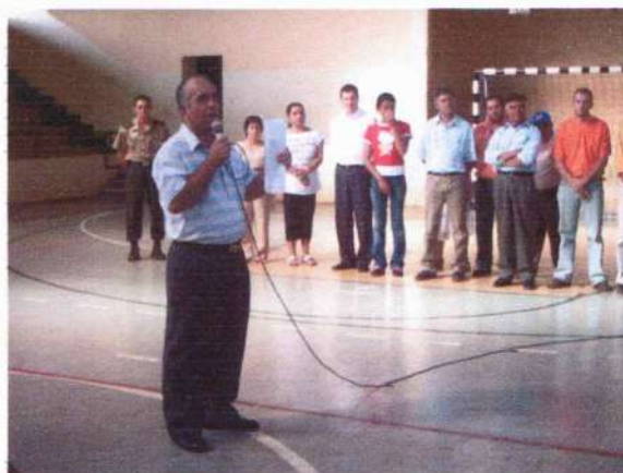
Palavras do Maestro Cardoso comentando sobre o projeto das aulas de musicalização infantil, e para jovens