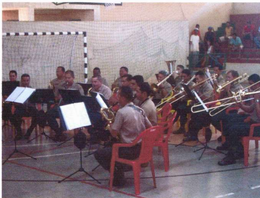
Apresentação da Banda de Música do Exército Brasileiro, muito aplaudida pela plateia.