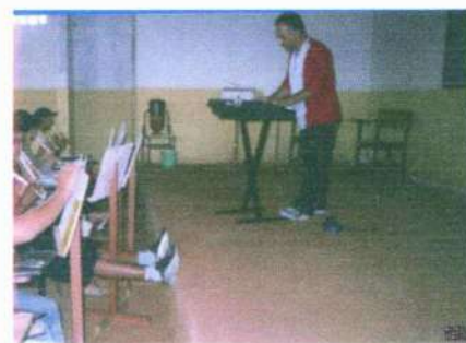
Alunos adolescentes, de iniciação musical no turno vespertino (ano 2005)