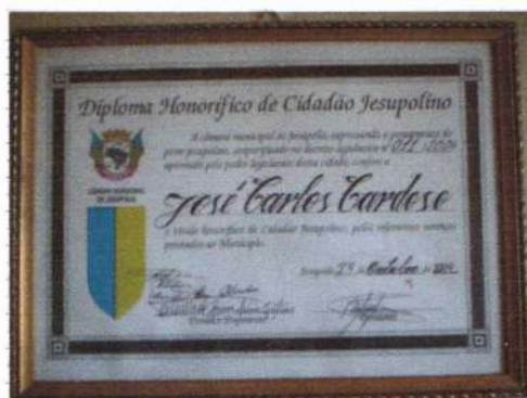
Diploma Honorífico de Cidadão Jesupolino