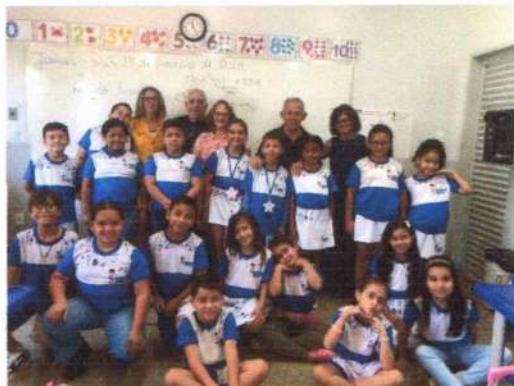
Palestra do autor da música, do hino EXALTAÇÃO A JESÚPOLIS, na escola municipal, em 14 de janeiro de 2025. Turma do 3º ano fundamental na sala de aula