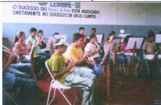
Primeiro ensaio juntos