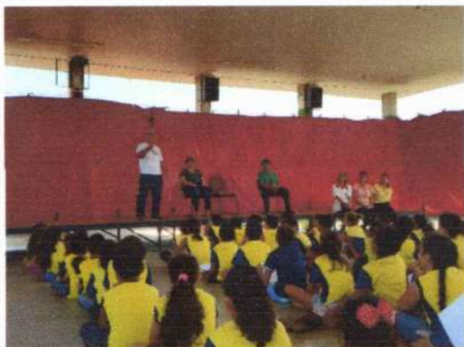
Palestra dos autores, sobre o hino EXALTAÇÃO A JESÚPOLIS, na escola municipal, no ano de 2023 Escola no pátio.